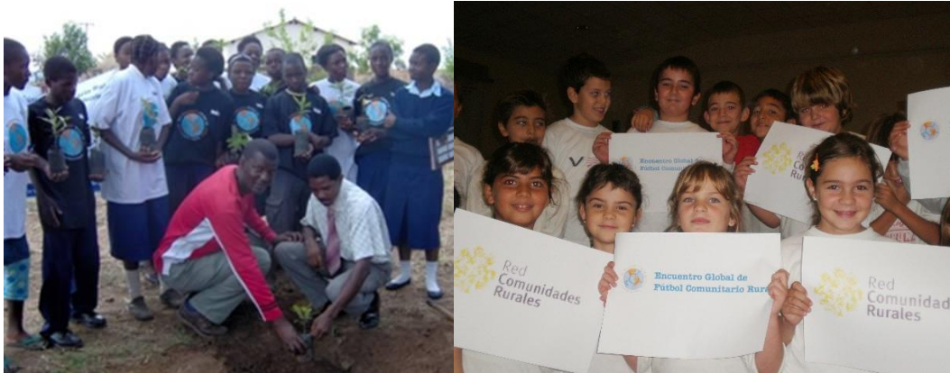
Plantación de árboles realizada por alumnos de una escuela rural en Zambia y niños en una escuela de un pueblo cercano a Barcelona, Cataluña, España. Dos de las cientos de acciones comunitarias realizadas en el marco de este encuentro.

Más de 200 escuelas y comunidades rurales de Argentina, Uruguay, Chile, Bolivia, Cuba, Costa Rica, España, Bosnia-Herzegovina, Azerbaijón, Malasia, Sri Lanka, Egipto, Congo y Zambia participaron del 2do. Encuentro Global de Fútbol Comunitario Rural . Miles de niños y jóvenes jugaron al fútbol el último viernes de octubre de 2010 celebrando las acciones solidarias que emprendieron junto a sus familias para ayudar a mejorar su escuela y comunidad. Los resultados fueron extraordinarios; huertas, bibliotecas ambulantes, plantación de árboles, funciones de teatro, plazas con juegos, campañas educativas y hasta la construcción de un camino a más de 3.500 msm. entre dos parajes antes incomunicados. Las acciones son locales pero la comunicación es global. Fotos, testimonios e intercambios viajan de una punta a la otra del mundo a través de www.futbolrural.org.ar